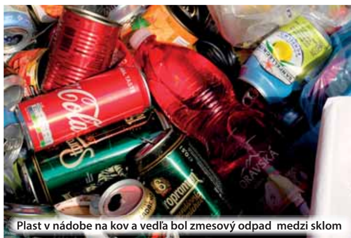
Plast v nádobe na kov a vedľa bol zmesový odpad medzi sklom

Len pre zaujímavosť, v súčasnosti každý občan EÚ vyhodí každý rok takmer pol tony komunálneho odpadu – čo je pre