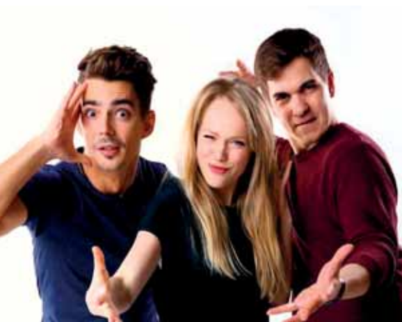
S hudbou vesmírnou.

možné pri hlavnom vstupe do areálu, kde bude označená kasička.